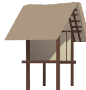
Un grenier sur 4 poteaux porteurs

Relis les restitutions à la bonne photographie prise sur le terrain :