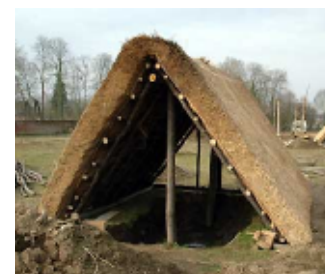
Une cabane sur fond excavé.