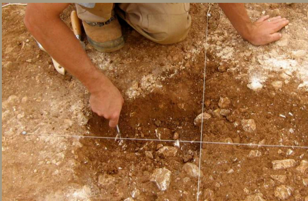
La fouille s'appuie sur des outils adaptés à la nature du site et des vestiges. La pelle et la pioche servent ainsi à dégager les déblais avant de fouiller plus finalement à la truelle.

La fouille archéologique commence par le décapage : il s'agit d'ôter la terre végétale qui recouvre les vestiges. Ces derniers apparaissent alors par contraste de couleur.