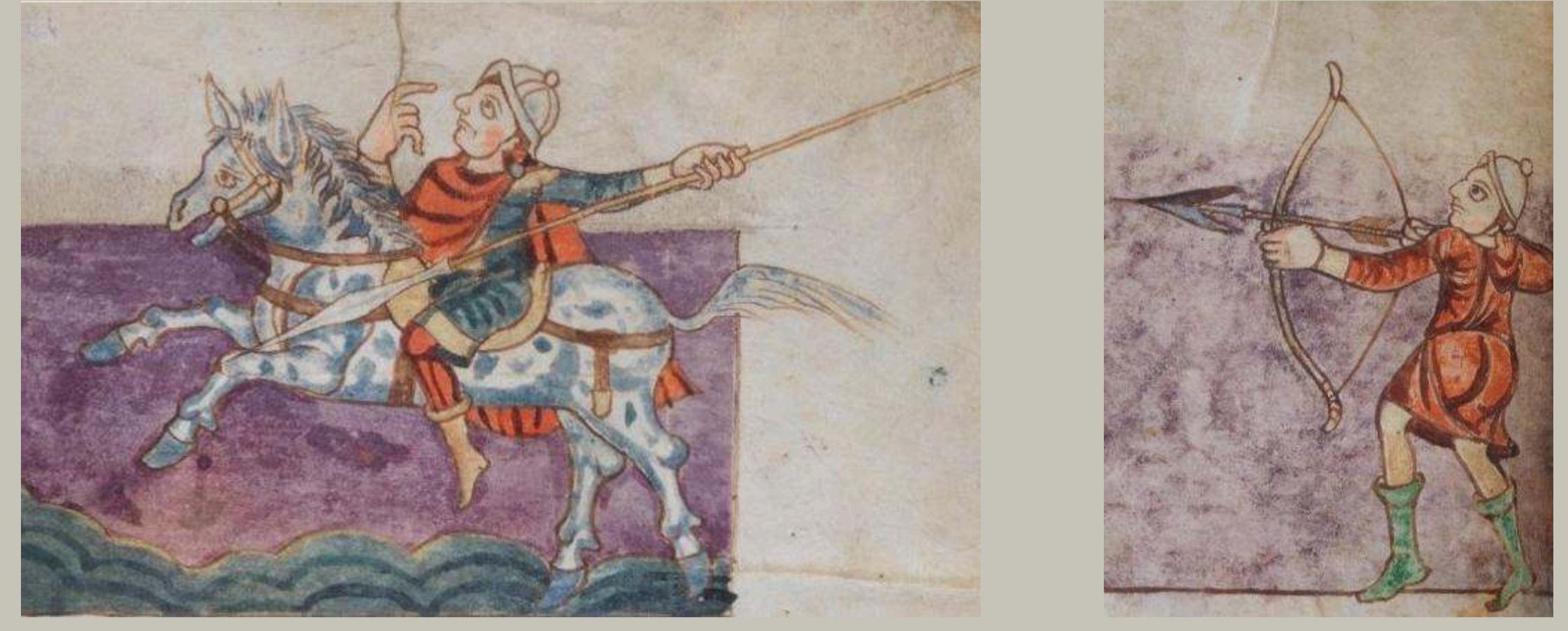
Représentation d'un chevalier et d'un archer. On distingue nettement l'aspect des armes (lance et arc) dont on ne retrouve en archéologie que les extrémités métalliques. Psautier de Stuttgart fait à l'abbaye de Saint-Germain-des-Près entre 820-830, Württembergische Landesbibliothek Stuttgart, Bibl. fol. 23

L'armement est représenté par des pointes de flèche, une pointe de lance et plusieurs carreaux d'arbalète.