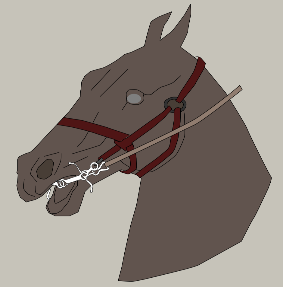
Dessin et restitution de l'emploi du mors. Objet archéologiquement rare, il est similaire à d'autres découvertes effectuées sur des sites aristocratiques : Charavines-Colletière (Lac de Paladru, Isère), mais surtout la résidence comtale d'Andone (Villejoubert, Charente). (© Eveha)

Une autorité avait donc la main-mise sur le village des Chesnats à la période carolingienne, mais laquelle ? S'agissait-il d'un pouvoir lié à un seigneur, à l'Église, ou encore à des paysans libres et aisés ?