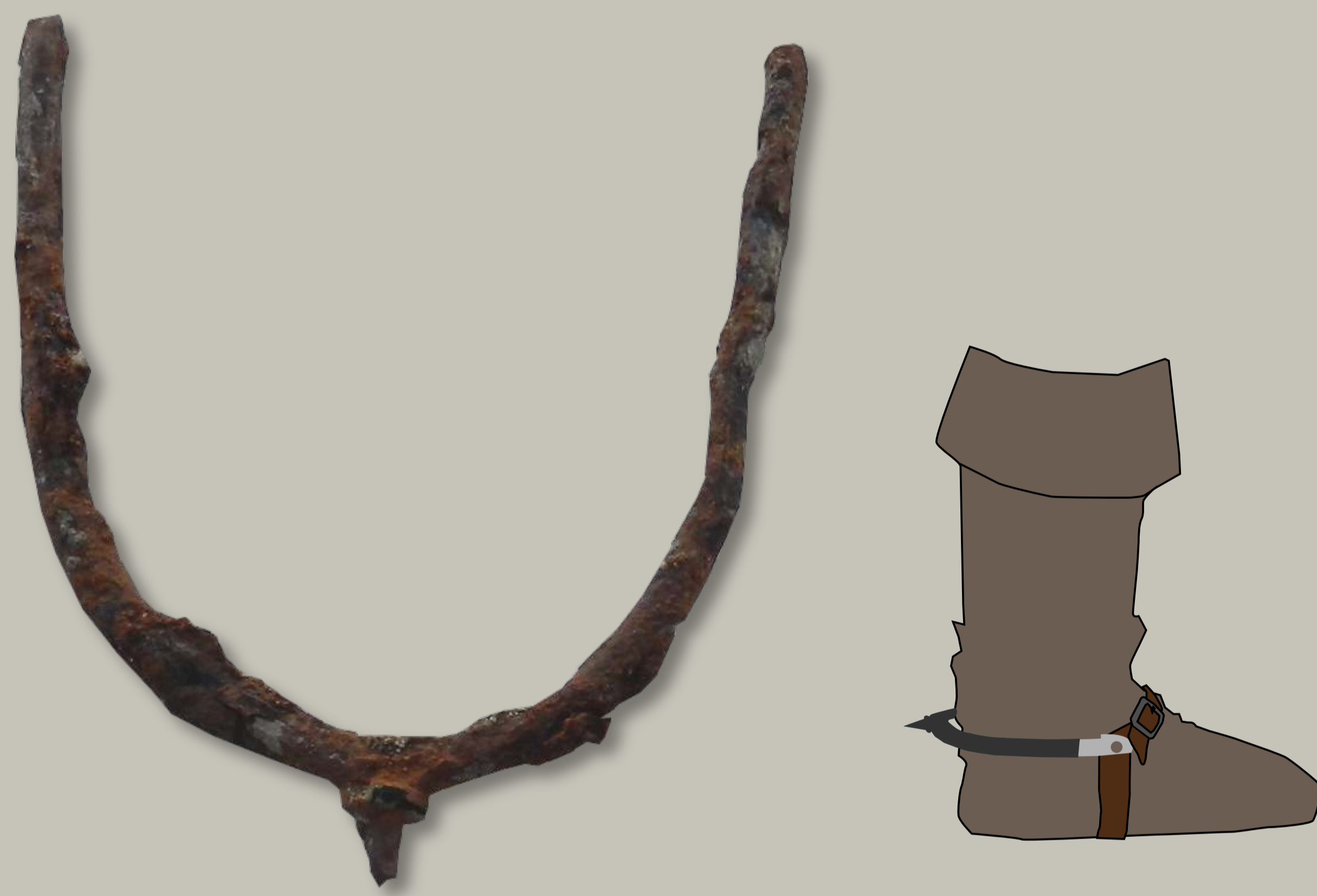
Photographie et restitution d'un éperon. Les extrémités étant manquantes, on ne peut restituer avec certitude le système d'accroche (boucle, rivet) à la botte du cavalier.